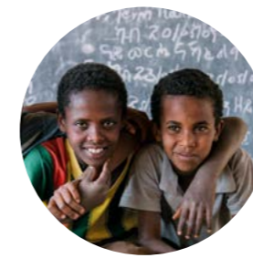
Entwicklungszusammenarbeit Langfristige und nachhaltige Projekte

Der dritte Arbeitsbereich von World Vision Deutschland ist die entwicklungspolitische Anwaltschaftsarbeit. Mit diesem Arbeitszweig möchten wir die Menschen in Deutschland über die Ursachen von Hunger, Armut und Benachteiligung in den Entwicklungsländern aufklären und sie zum verantwortungsvollen Handeln motivieren. Rund 160.000 Paten und Spender haben im Finanzjahr 2019 mit ihren Spenden die Arbeit von World Vision