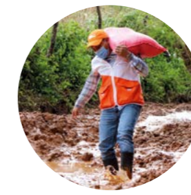
Humanitäre Hilfe Schneller Einsatz bei Katastrophen