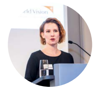
Anwaltschaftsarbeit Lobbyarbeit für die Armen

Deutschland zugunsten bedürftiger Menschen ermöglicht. Insgesamt konnten so 280 Projekte in 48 Ländern umgesetzt werden.